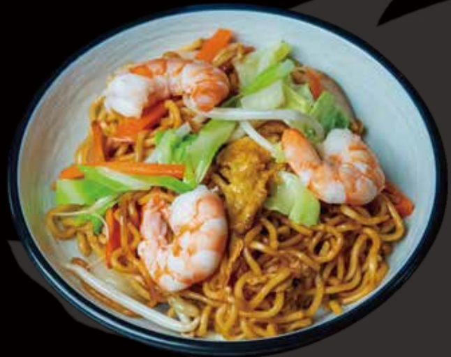
31 YAKISOBA CON POLLO yakisoba with chicken