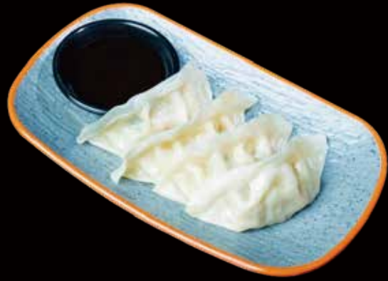
125 GYOZA DE CARNE 4U pork gyoza 4p