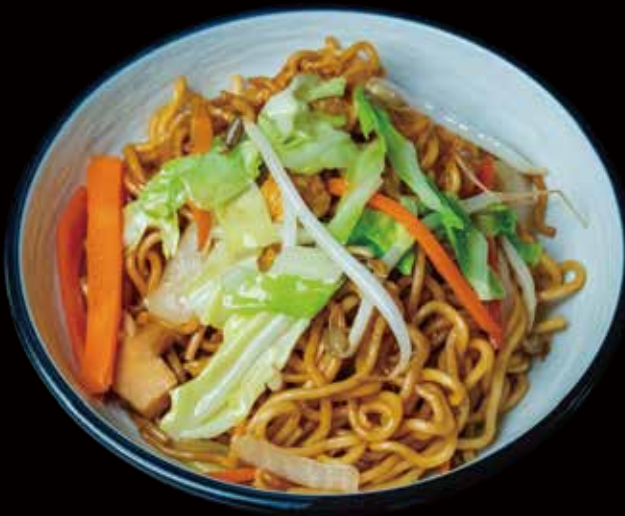
29 YAKISOBA CON VERDURAS yakisoba with vegetables