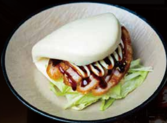
129 BAO CON PATO 1U bao with duck 1p