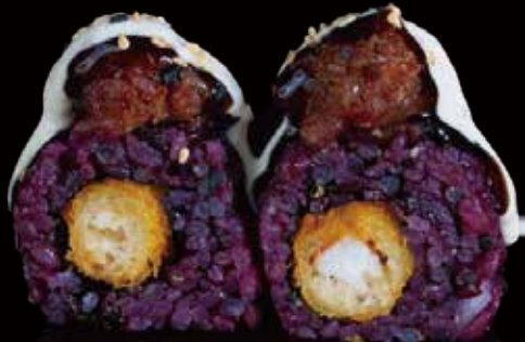
330 URA BLACK GAMBAS FRITAS CON ATÚN 4u black ura fried shrimp with tuna 4p