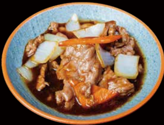
52 TERNERA CON VERDURAS beef with vegetables