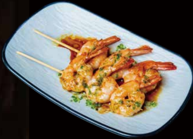
76 BROCHETA DE GAMBONES A LA PLANCHA 2U grilled prawn skewer 2p