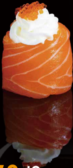
259 JO FLOR 1u flower jo 1p