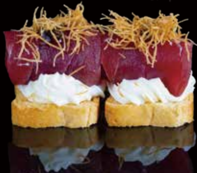
202 CROSTINO DE ATÚN 2u tuna crostini 2p