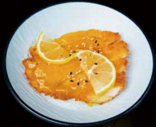
58 POLLO FRITO AL LIMÓN lemen flavored fried chicken