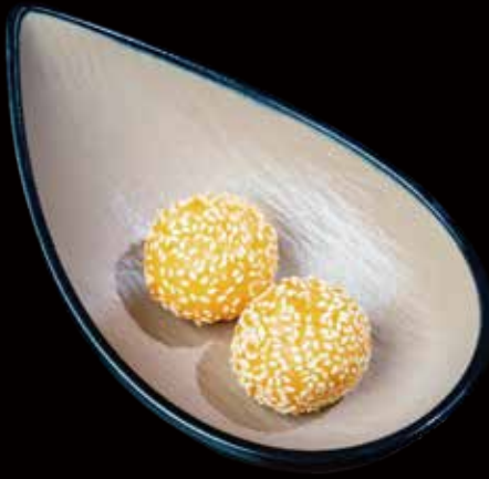
98 BOLA DE SÉSAMO 2U sesame balls 2p