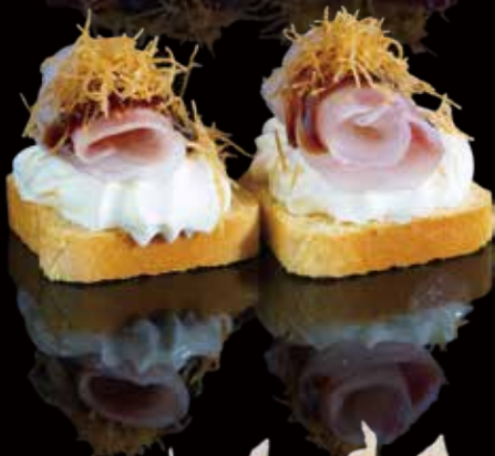
203 CROSTINO DE SUZUKI 2u suzuki crostini 2p