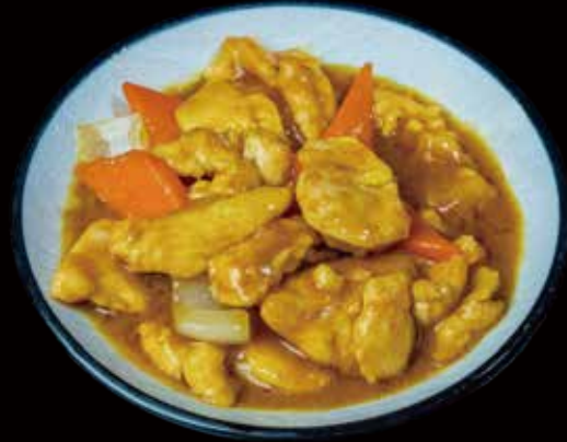
51 POLLO AL CURRY curry chicken