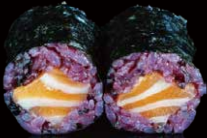
280 HOSOMAKI BLACK DE SALMÓN 6u black salmon hosomaki 6p