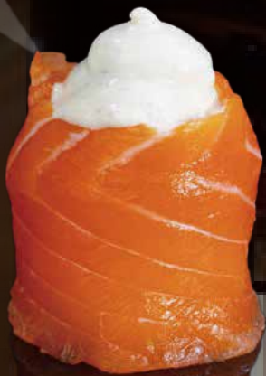
261 JO TARTUFATA 1u truffle jo 1p