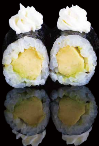
275 HOSOMAKI CON AGUACATE Y PHILADELPHIA 6u avocado and philadelphia hosomaki 6p