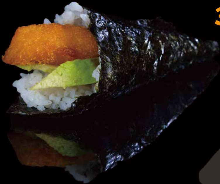
340 TEMAKI DE GAMBAS 1u shrimp temaki