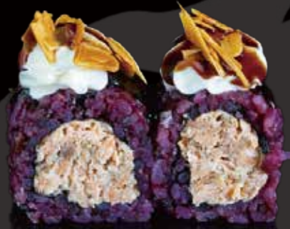
331 URA BLACK SALMÓN COCIDO 4u black cooked salmon ura 4p