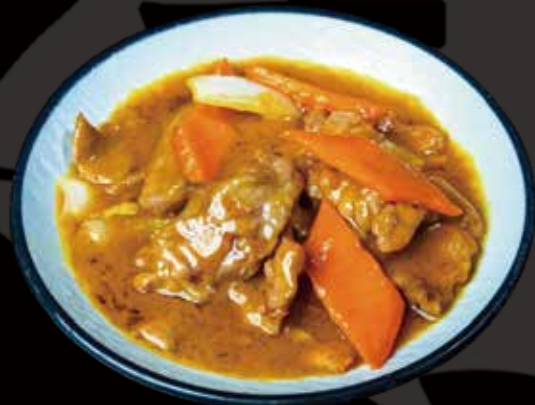
53 TERNERA AL CURRY curry beef