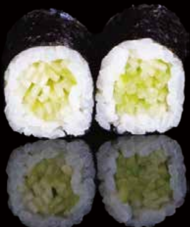
270 HOSOMAKI CON PEPINO 6u cucumber hosomaki 6p