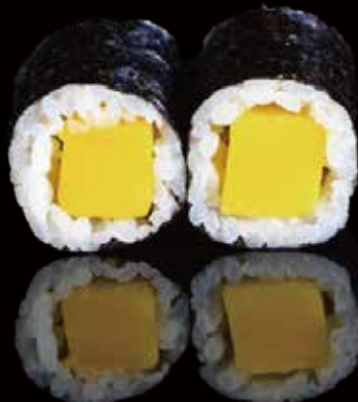
271 HOSOMAKI CON MANGO 6u mango hosomaki 6p