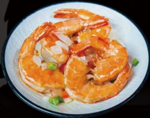
57 GAMBA CON SAL Y PIMIENTA salt and pepper shrimp