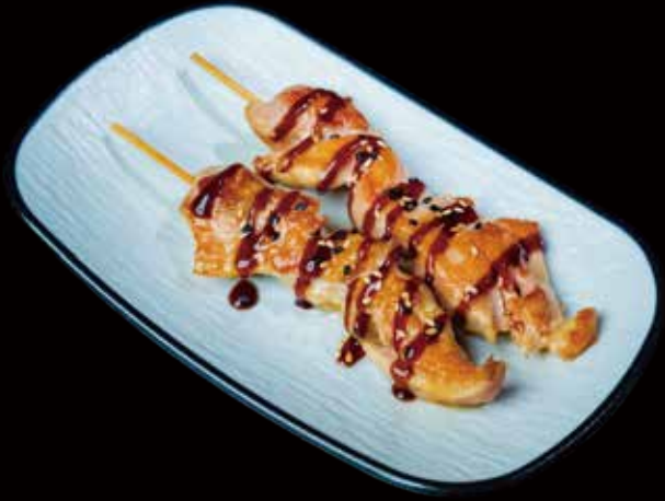
77 BROCHETA DE POLLO A LA PLANCHA 2U grilled chicken skewer 2p