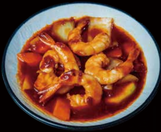
55 GAMBA PICANTES spicy shrimp