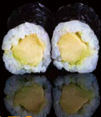
272 HOSOMAKI CON AGUACATE 6u avocado hosomaki 6p