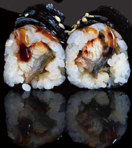
279 HOSOMAKI CON UNAGUI (ANGUILA) 6u eel hosomaki 6p