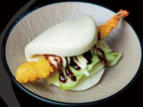
127 BAO CON GAMBAS FRITAS 1U bao with fried shrimp 1p