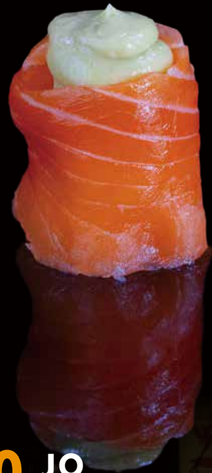
260 JO AGUACATE 1u avocado jo 1p