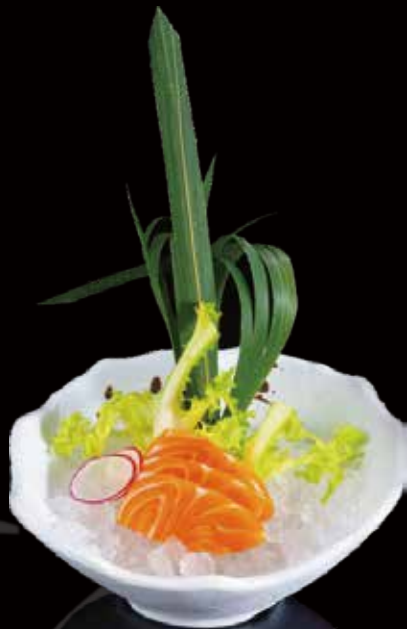
350 SASHIMI SALMÓN 3u salmon sashimi 3p