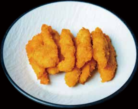
103 TIRAS DE POLLO FRITO fried chicken strips