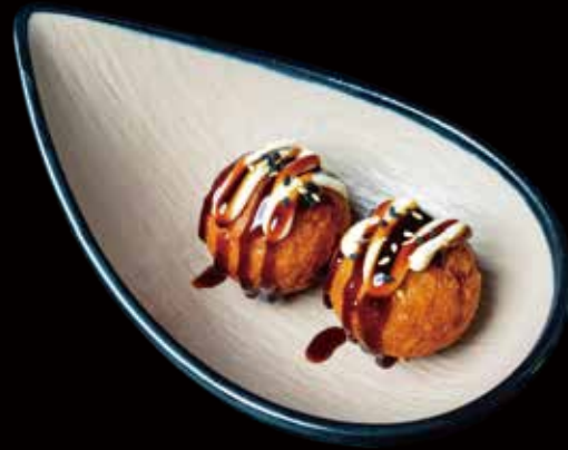
99 TAKOYAKI 2U (BOLAS DE PULPO) Takoyaki (Octopus Balls) 2p