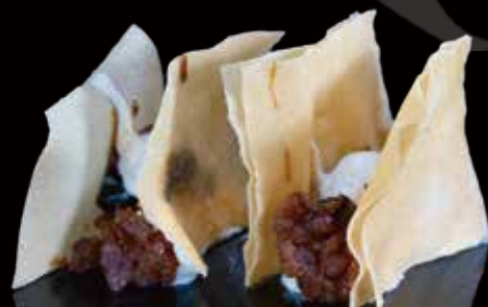
205 HOJALDRE CRUJIENTE CON TARTAR DE ATÚN 2u crispy puff pastry with tuna tartare 2p