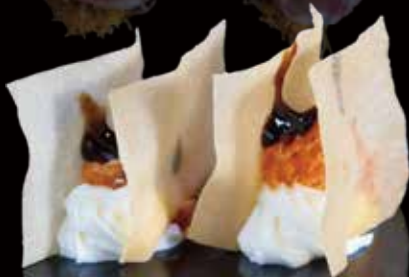
204 HOJALDRE CRUJIENTE CON TARTAR DE SALMÓN 2u crispy puff pastry with salmon tartare 2p