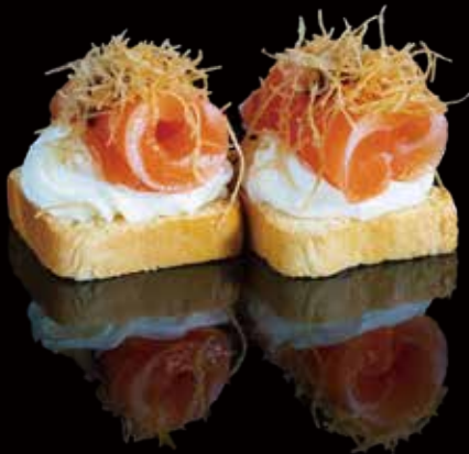
201 CROSTINO DE SAKE 2u salmon crostini 2p