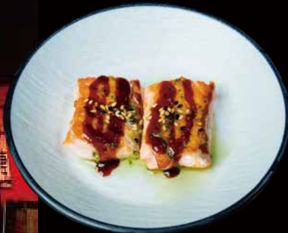
78 SALMÓN A LA PLANCHA 2U grilled salmon 2p