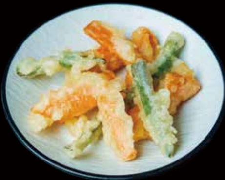
101 TEMPURA DE VERDURAS 4U vegetable tempura 4p