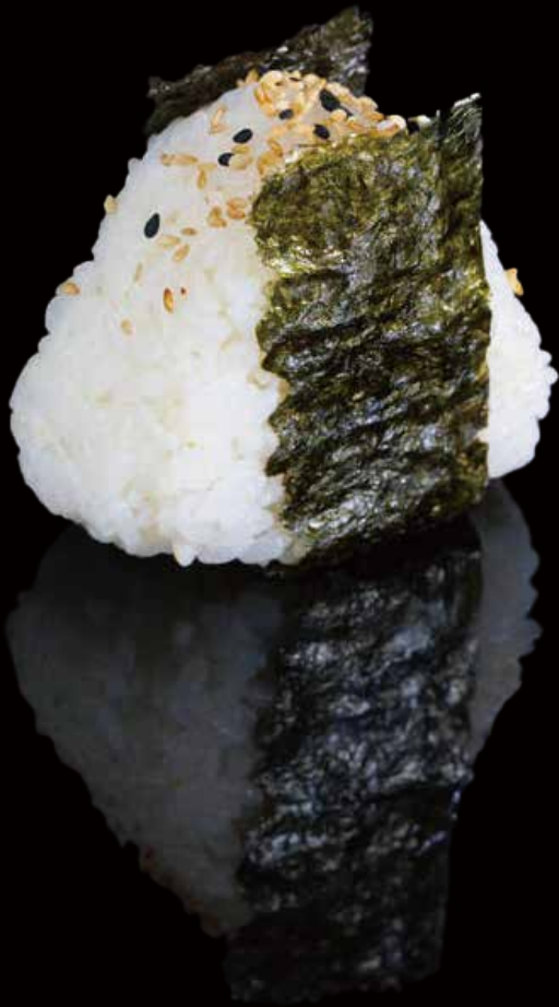
342 ONIGIRI SALMÓN COCIDO 1u cooked salmon onigiri