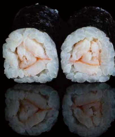
277 HOSOMAKI CON GAMBAS 6u shrimp hosomaki 6p