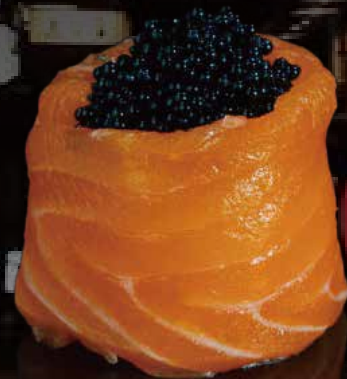
262 JO TOBIKO NEGRO 1u black tobiko jo 1p