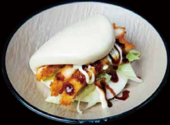
128 BAO CON PECHUGA DE POLLO FRITA 1U bao with fried chicken breast 1p