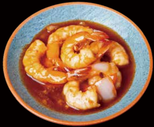
56 GAMBA AGRIDULCES sweet and sour shrimp