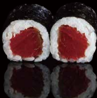
274 HOSOMAKI CON ATÚN 6u tuna hosomaki 6p