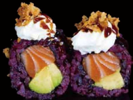
329 URA BLACK SALMÓN CON AGUACATE 4u black ura salmon with avocado 4p