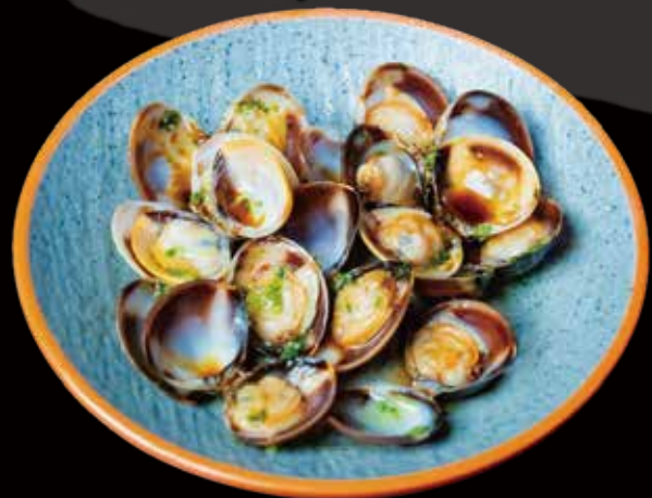
79 ALMEJAS A LA PLANCHA grilled clams