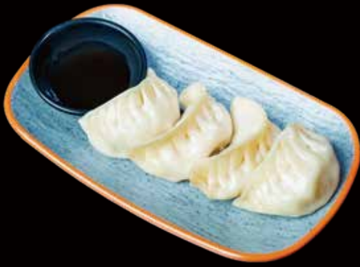
124 GYOZA VEGETAL 4U vegetable gyoza 4p