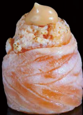
257 JO DE SALMÓN FIRE 1u salmon fire jo 1p