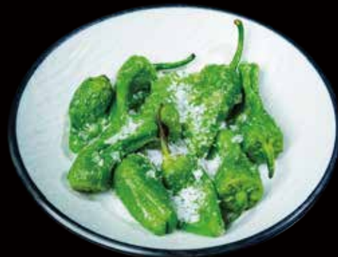
102 PIMIENTOS FRITOS fried peppers