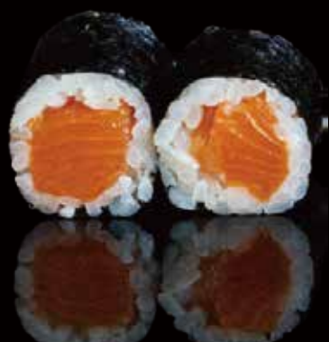
273 HOSOMAKI CON SALMÓN 6u salmon hosomaki 6p