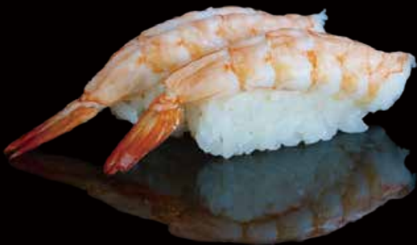
242 NIGIRI DE GAMBA 2u shrimp nigiri 2p