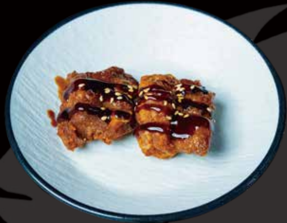
92 ALITAS DE POLLO 2U chicken wings 2p