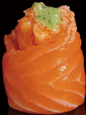
255 JO DE SALMÓN PICANTE 1u spicy salmon jo 1p