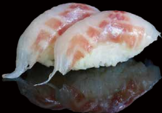
243 NIGIRI DE LUBINA 2u seabass nigiri 2p