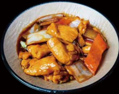
50 POLLO CON VERDURAS stir fried chicken with vegetable