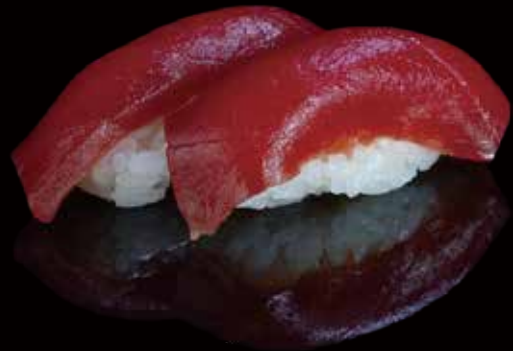
241 NIGIRI DE ATÚN 2u tuna nigiri 2p