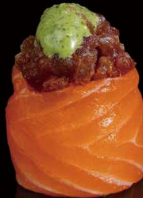
256 JO DE ATÚN PICANTE 1u spicy tuna jo 1p