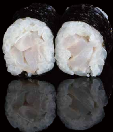
278 HOSOMAKI CON SUZUKI 6u suzuki hosomaki 6p